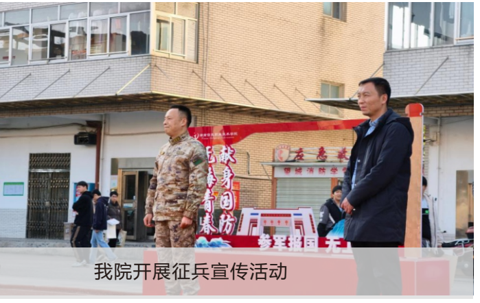
我院开展征兵宣传活动

为进一步激发广大青年学子参军报国热情，扎实推进征兵工作，1月7日，望城区人民武装部部长左先勇来到我院开展征兵宣传活动，看望慰问学院军事类学生社团。学院武装部工作人员参加。 “当兵去，去当兵，勇披狼痕真英雄。当兵去，去当兵，铁甲洪流我驰骋……”活动在望城区人民武装部自创歌曲《当兵去》中拉开序幕。我院军事类学生社团“雷锋教导团”嘹亮的口号响彻全场，在指挥员的口令下，全体队员精神饱满、整齐划一，完成了擒敌拳、摆拳踢腿和侧踢操等表演科目，迅猛有力而又飒爽的摆拳踢腿赢得在场师生的掌声。 科目展示之后，左先勇为学生们讲述了国家安全内涵与重要性，激发了学生强烈的共鸣。他强调，高校在培养军事科技人才中发挥着重要的作用，师生要将个人理想融入国家发展中，传承爱国精神，为强国建设、民族复兴贡献力量。 学校积极响应国家号召，与望城区人民武装部紧密合作，通过精准动员，已累计向部队输送数百名政治坚定、素质过硬、作风优良的优秀学子。下一步，学院文武部将持续做好精准动员，扎实推进征兵工作高质量开展。 (学生工作处)