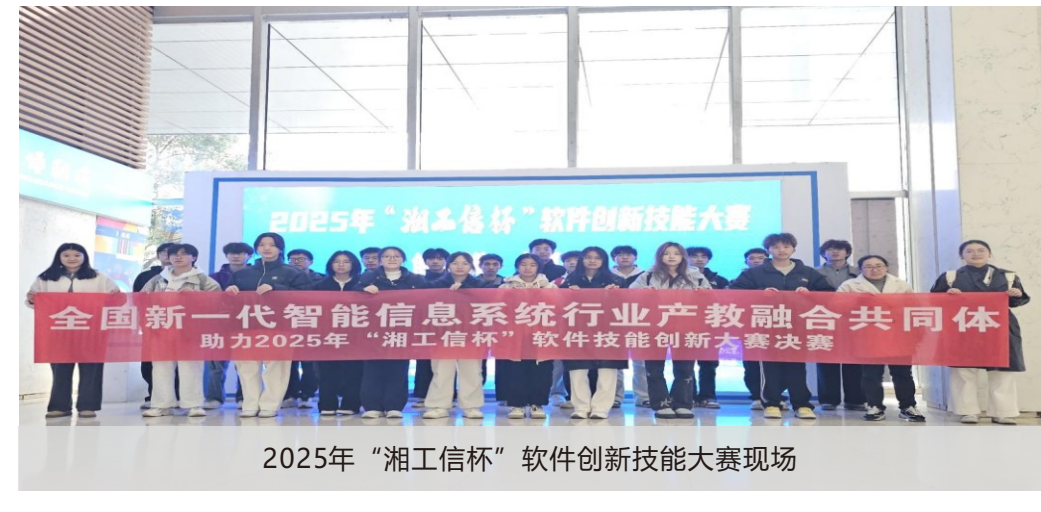
2025年“湘工信杯”软件技能创新大赛现场

为响应国家关于深化产教融合、推动制造业高质量发展的战略部署，近日，我院作为全国新一代智能信息系统行业产教融合共同体（以下简称“共同体”）牵头单位，充分发挥其资源整合与协同育人的优势，在长沙中电软件园总部与相关单位联合举办了2025年“湘工信杯”软件技能创新大赛决赛。 此次大赛面向湖南省内从事软件研发工作的专业技术人员和在湘高等院校、职业院校全日制在读学生，旨在通过搭建竞技平台，推动软件技术交流与学习，提升软件人才的专业技能和创新能力。我院是湖南省职业教育领域的一支重要力量。作为共同体的牵头单位，学院积极承担推动区域产教融合的重要职责，不仅深度参与赛事组织与筹备工作，还以此次大赛为契机，积极搭建校企合作育人桥梁，促进产学研深度融合，探索软件专业人才培养新模式，为湖南省软件行业的发展升级提供了有力的人才保障。 此次大赛的成功举办，不仅彰显了我校软件专业人才培养优势与发展前景，还积极推动了共同体在软件产业创新发展中的重要作用，丰富了成员单位人才培养实践场景，为专业人才培养提供了与行业前沿接轨的机会，也为未来深化产教融合、培养优秀软件人才奠定了坚实基础。(软件学院)