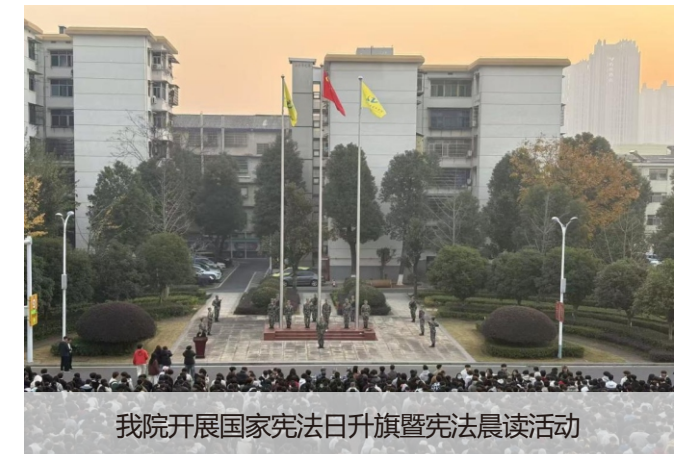
我院开展国家宪法日升旗暨宪法晨读活动

为深入学习贯彻宪法精神，12月4日，我院开展国家宪法日升旗暨宪法晨读活动，全院师生代表齐聚现场，共同参与这场法治教育实践课。 活动在庄严的升旗仪式中拉开帷幕。升旗礼毕，师生们共同诵读《中华人民共和国宪法》核心条款。从“中华人民共和国公民在法律面前一律平等”到“维护祖国安全、荣誉和利益”，一字一句的诵读，让宪法精神深深扎根在师生心中。学生代表表示，通过宪法晨读不仅重温了宪法的内容，更深刻地理解了作为公民的权利与责任，今后会将宪法精神更加深刻地融入学习到生活中。 此次活动是学院法治教育系列举措的一环，通过沉浸式诵读让师生近距离学习宪法，强化了大家对宪法作为国家根本大法的认知，提升了大家的法治意识与法治素养。后续，学院还将依托主题班会、法治讲座、知识竞赛等形式，持续推动宪法学习走深走实，引导青年学子成长为尊法学法守法用法的新时代青年。 (院团委)