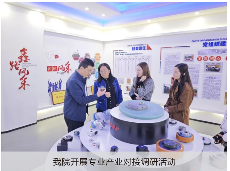
我院开展专业产业对接调研活动

为进一步推动职业教育与区域产业需求实现精准对接，提升职业教育对产业发展的适应性，12月中下旬，我院湖南省“楚怡工坊”、技能大师工作室、“楚怡名师”工作室负责人一行赴新乡高新区、望城经开区开展了一场聚焦职业教育服务产业发展的专项调研活动。 我院调研团队深入智能制造企业生产一线与行业专家开展深度对话，听取了长沙贝斯特热流道科技有限公司、万鑫精工（湖南）股份有限公司等相关企业负责人关于学生进入工作岗位后的具体情况，并围绕校企合作、学生技能结构与知识储备、企业用工需求等方面进行了深入探讨。针对调研中发现的问题，我院相关工作室将依托“项目+平台”协同发展模式，与企业共同推进育人项目，积极参与现代产业学院、市域产教联合体等平台建设，在制造类技能人才培养过程中融入信息技术与工业互联网知识，优化培养方案与课程设置，打造贴近产业需求的课程体系，提升学生的综合素养和职业能力。 此次调研以产业对智能制造类技能人才的需求为导向，旨在精准探索产教融合过程中存在的痛点问题以及可行的突破路径，深度探索智能制造产业对电工、钳工等关键技能人才培养的适应性需求以及创新实践模式。未来，我院将持续创新产教融合模式，提升职业教育的适应性，为区域产业升级和经济发展培养更多高素质技能人才。 (科技处)