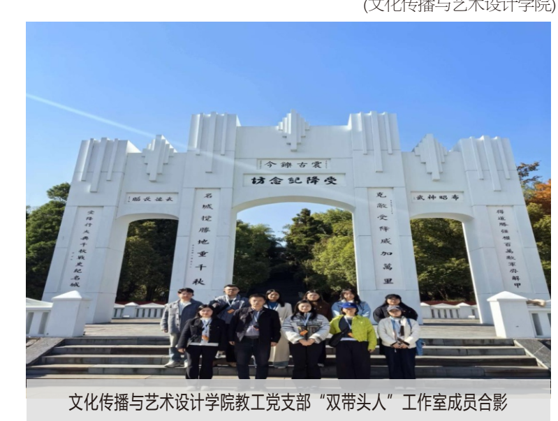
文化传播与艺术设计学院教工党支部“双带头人”工作室成员合影

据悉，本次活动影像资料将精心制作，成为学院党员教育和课程思政的鲜活教材。活动成功探索了“党建+专业”新路径，强化了党员教师“为党育人、为国育才”的使命担当。大家表示，要将汲取的精神力量转化为工作动力，发挥“双带头人”示范引领作用，推动党建与教学科研双融双促，以更创新形式、更深厚情怀投身立德树人崇高事业。