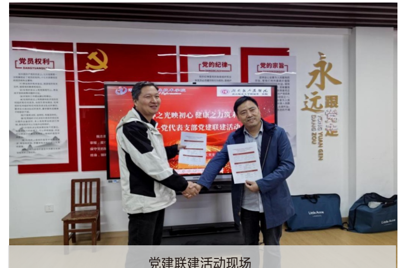
党建联建活动现场