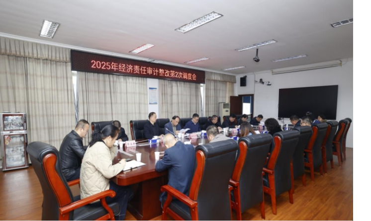
学院召开2025年经济责任审计整改第2次调度会

会上，审计处负责人通报了整改工作进展情况，提出了下一阶段工作任务。参会部门负责人汇报了整改工作过程中存在的问题和下一步工作举措。（审计处）